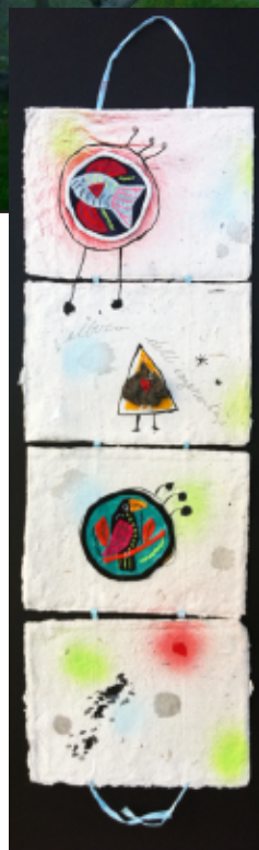
"L'albero dell'ingenuità" installazione di Renata Giannelli

CIVICO32 , associazione non riconosciuta senza fini di lucro, è nata e vivrà per stimolare le persone ad un nuovo interesse per la vita della comunità e contribuire allo sviluppo di tutte le forme, vecchie e nuove, di aggregazione, di comunicazione, di dialogo, di confronto e di scambio di idee e di opinioni, di interazione e integrazione tra le persone.